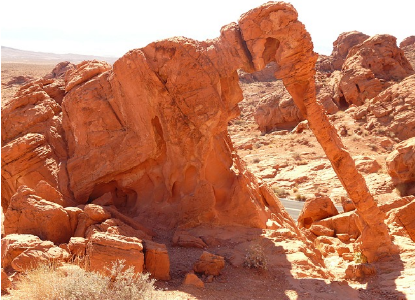
Figure 1: PostgreSQL